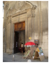
ESPACE SAINT MARTIAL AVIGNON