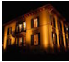
THÉÂTRE OXYMORE CULLY