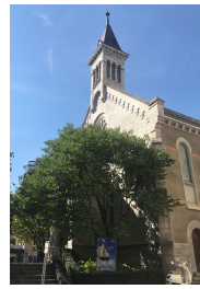
ESPACE CULTUREL TERREAUX LAUSANNE