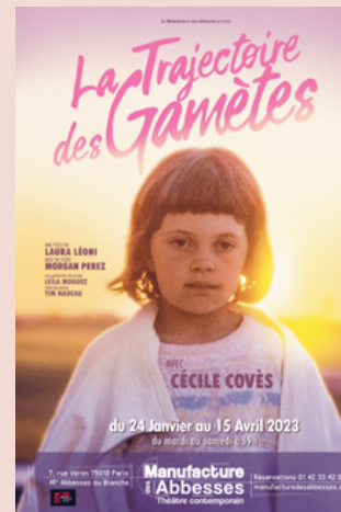
Succès à Avignon et en tournée dans toute la France