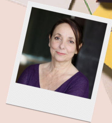
CHRISTINE GAGNEPAIN Comédienne