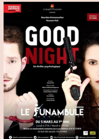
Prix du Meilleur Comédien (Avignon 2018)