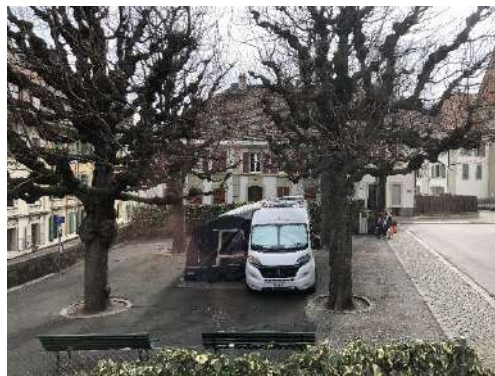
Dimensions : 6m/5m au sol, 3m de haut, prise électrique 230V 16A (prise ordinaire)

C'est pourquoi T-âtre s'est équipé d'une deuxième structure encore plus légère (montage en 30mn et démontage en 30mn) : un Camping-Car avec auvent, qui peut aussi servir de loge.