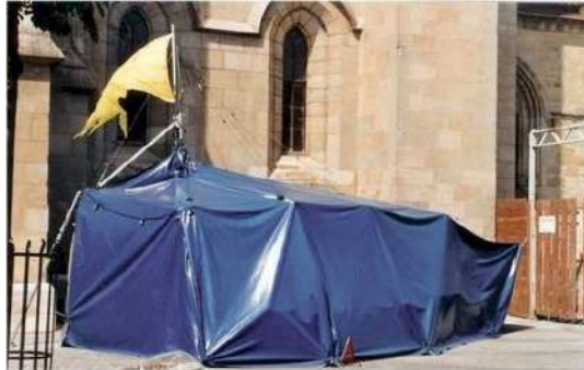
Dimensions : 8m/8m. avec 1 mât à 5m40, et prise électrique 230V 16A (prise ordinaire)

Depuis plus de 20 ans maintenant, T-âtre gère un camion-chapiteau, véritable structure théâtrale itinérante, compacte et modulable, et surtout très mobile : montable en 1h30, et démontable en 1h30. Pouvant accueillir jusqu'à 80 spectateurs dans un espace chaleureux et intimiste, ce camion a permis de porter les créations de la metteuse en scène Isabelle Bonillo de places de villages en préaux d'école, du Luxembourg au sud de la France, se prêtant aussi bien à des opérations de médiation culturelle (communautés de commune, régions...) qu'à une installation au sein d'un Festival (Aurillac, Villeneuve-en-scène, OFF Avignon, Plage des six pompes...), et en collaboration avec le Théâtre National du Luxembourg, le Théâtre de la Ville de Luxembourg et la Kulturfabrik d'Esch s/Alzette, le Centre Dramatique de Basse-Normandie, la Comédie de Genève et le Théâtre du Passage de Neuchâtel.